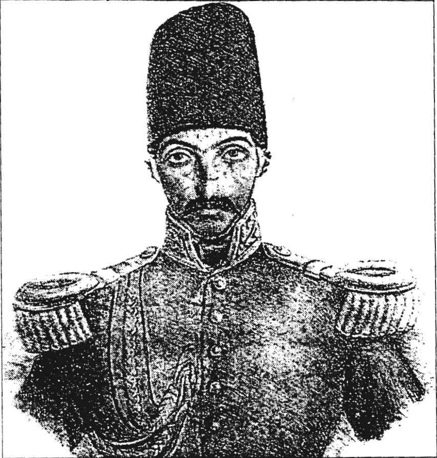
شاهزاده جلال الدین میرزا (قاجار)

به نقل از صفحه ۴، شماره ۴۷۴ روزنامه دولت علیه ایران، ۱۲۷۷ قمری.