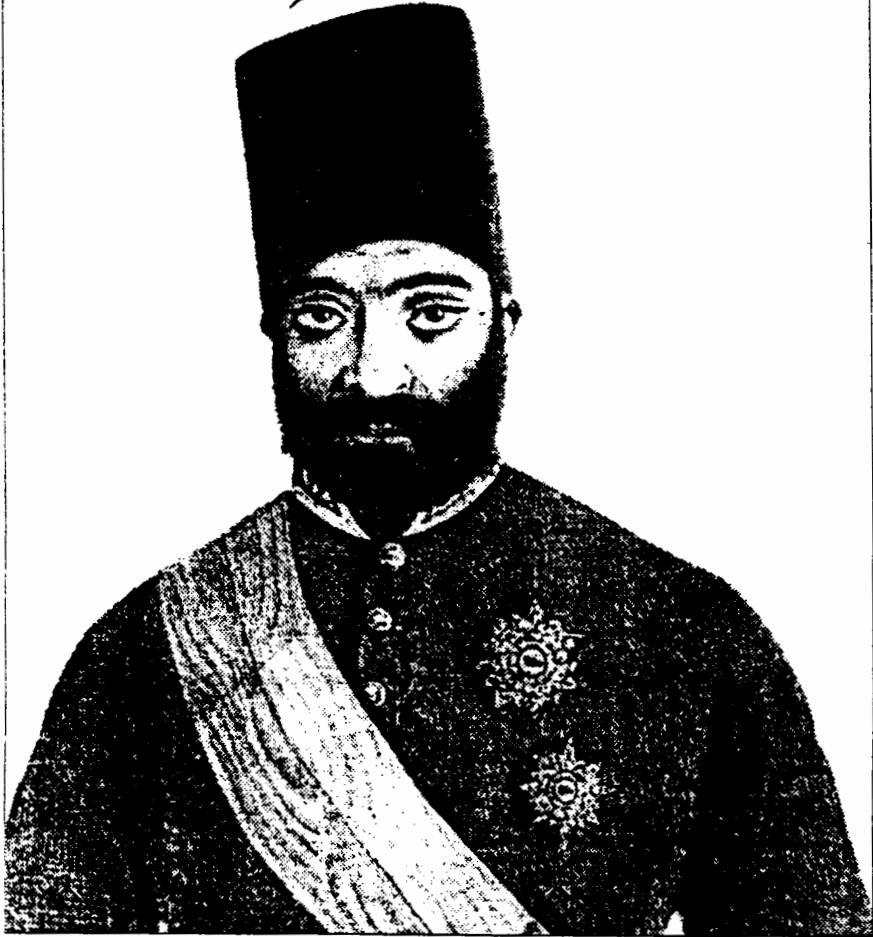
میرزا یوسف خان مستشارالدوله

به نقل از صفحه ۵ ، شماره ۴۹۳ روزنامه دولت علیه ایران ۱۲۷۷ قمری