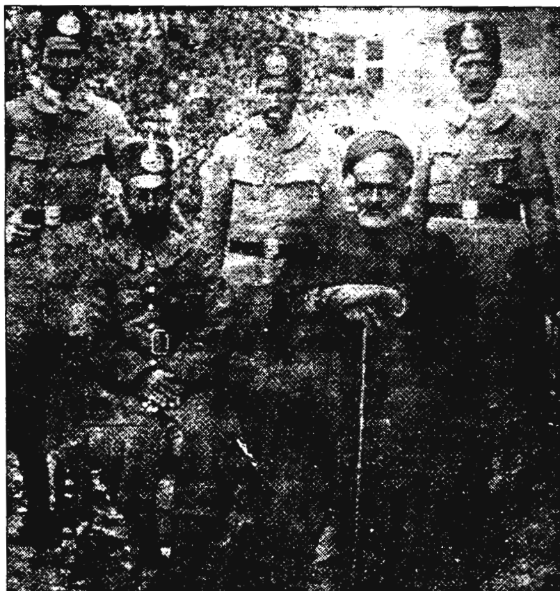
اشرف الدین حسینی (نسیم شمال) در بین نگهبانان دارالمجانین تهران. در ۱۳۰۶ شمسی (۱۳۴۵ قمری)، عمال حکومت این شاعر مشهور عصر را به اتهام جنون روانه دارالمجانین کردند.