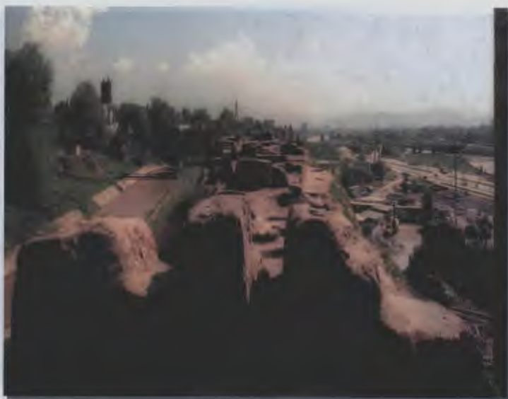
۳۳- شهرها و شهرک‌های باستانی