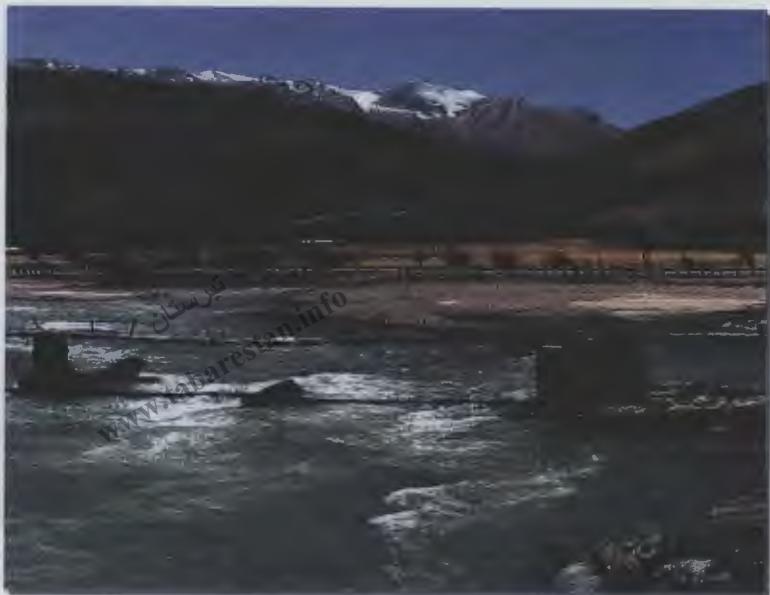
۵- رودخانه‌ها (دریاها)