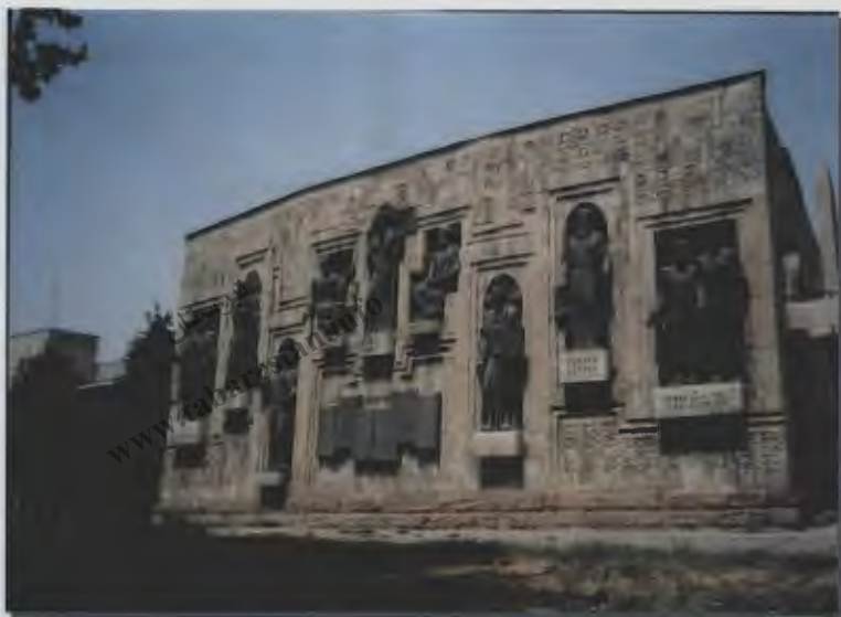
۲۶- نمایی از ساختمان اتحادیه نویسندگان