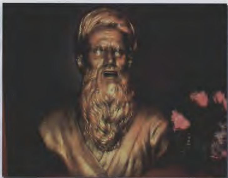
۲۷- تندیس رودکی