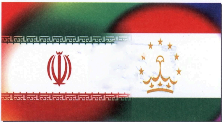
۴۵- روابط دوجانبهٔ جمهوری اسلامی ایران با جمهوری تاجیکستان