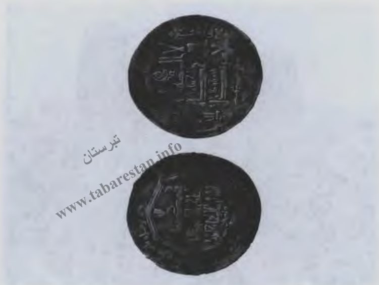
۳۲- آثار تاریخی و فرهنگی