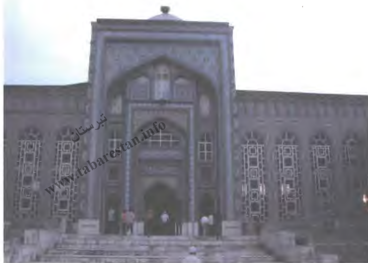
۳۶- نمای بیرونی مسجد جامع شهر دوشنبه