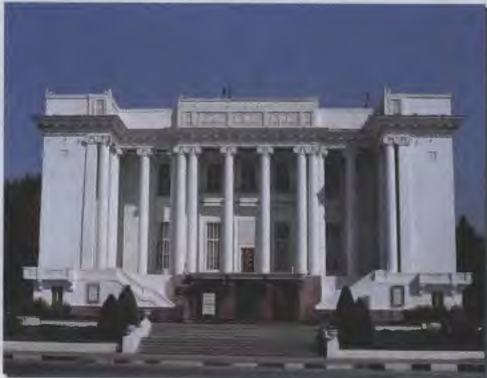
۳۱- نمای بیرونی بنای موزه ملی باستانی