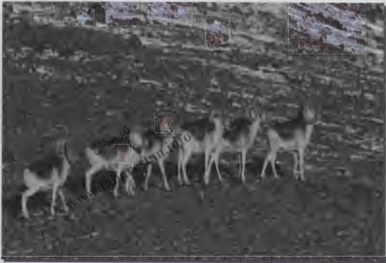
۷- حیوانات گله قوچ کوهی در ارتفاع ۴۹۰ متری