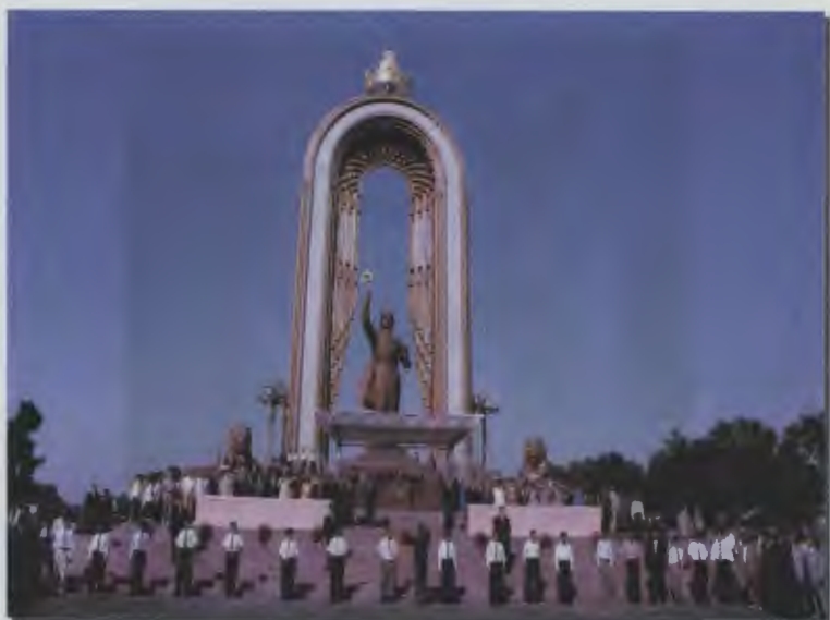
۱۹/۲ - مراسمی از یک جشن (میدان سامانی)