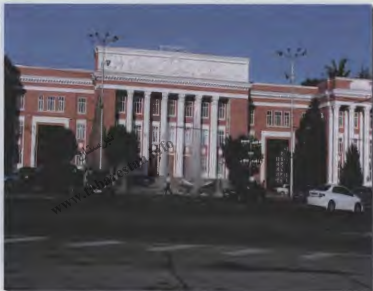
۱۳- ساختمان مجلس (میدان سامانی)