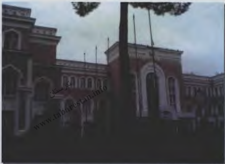
۲۴- دانشگاه ملی جمهوری تاجیکستان