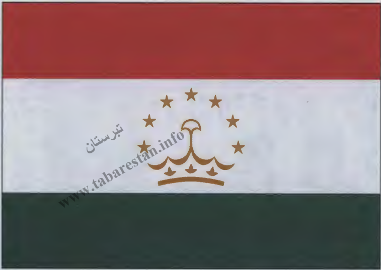
۱۵- پرچم دولتی تاجیکستان