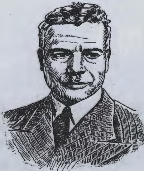
۱۶- ابوالقاسم لاهوتی