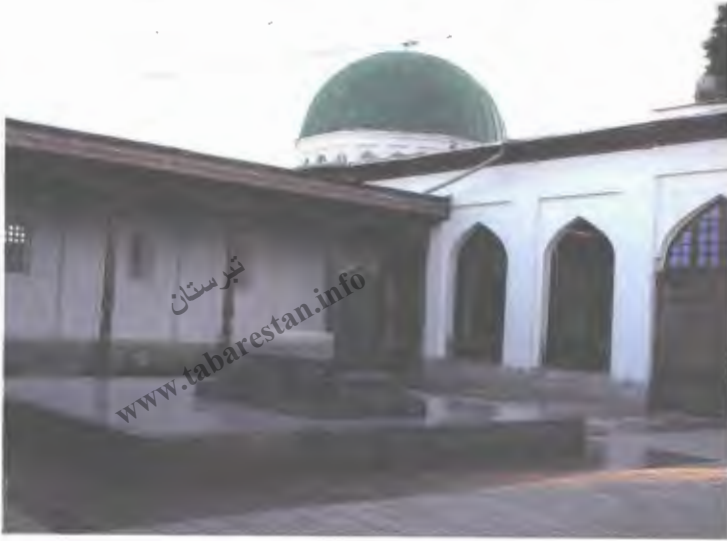
۳۸- مزارها مولانا چرخى