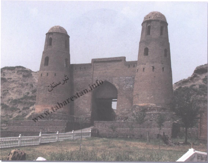
۳۴- قلعه حصار