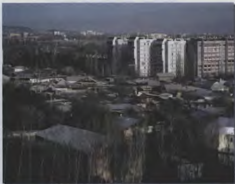
۱۲- منظره عمومی شهر دوشنبه