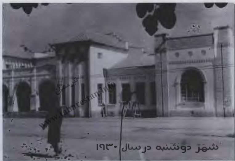
۱۱- شهر دوشنبه