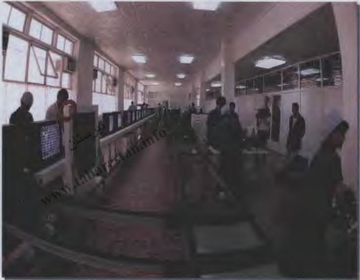
۲۲- فعالیت‌های اقتصادی