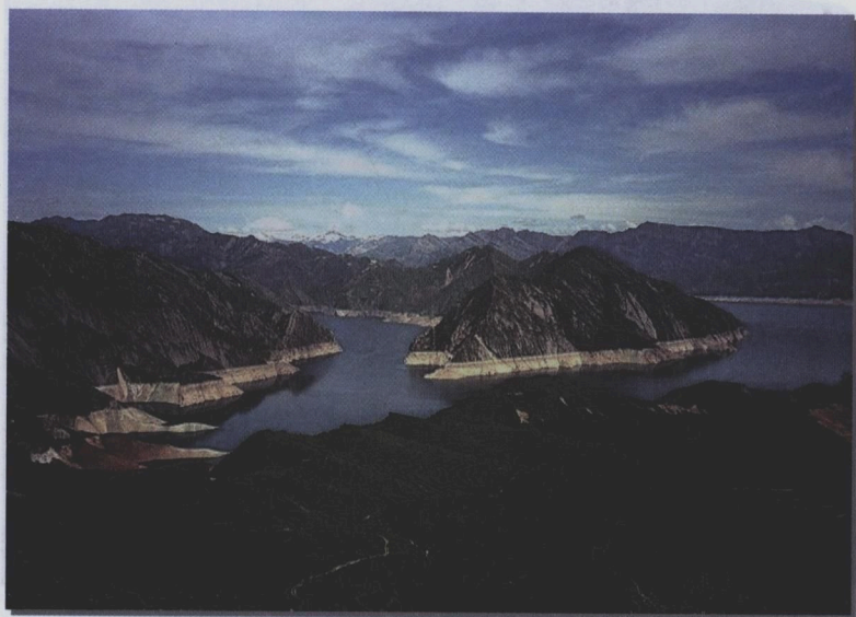
۴- سد‌ها و آب‌بندان‌ها