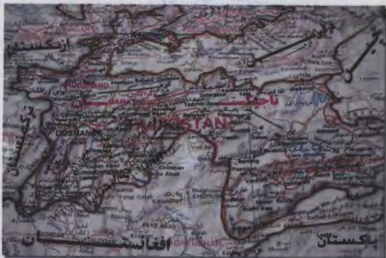
۱- موقعیت جغرافیایی تاجیکستان