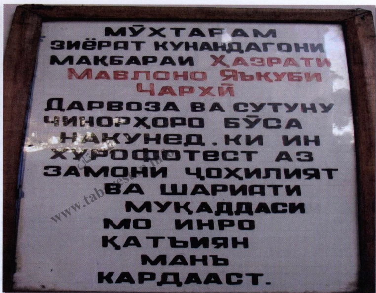
۴۴- نمونه الفباى تاجيکى