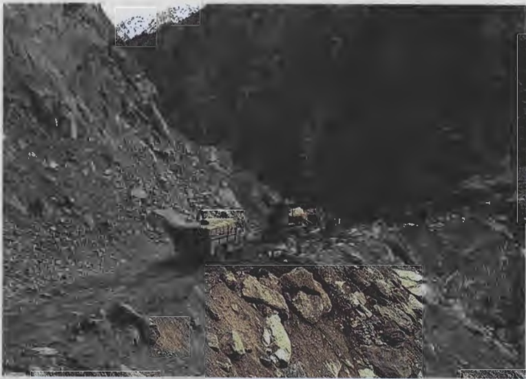
۸- معادن (ثروت‌های) طبیعی