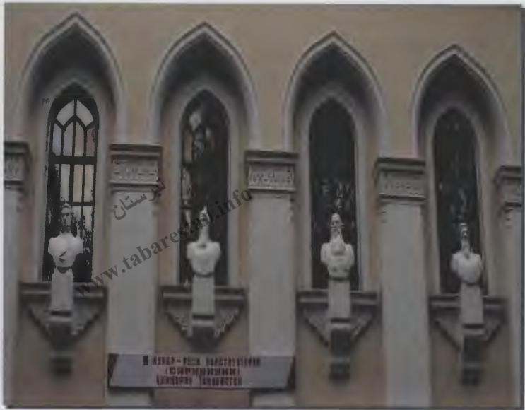
۳۰- نمای بیرونی ساختمان کتابخانه ملی به نام ابوالقاسم فردوسی