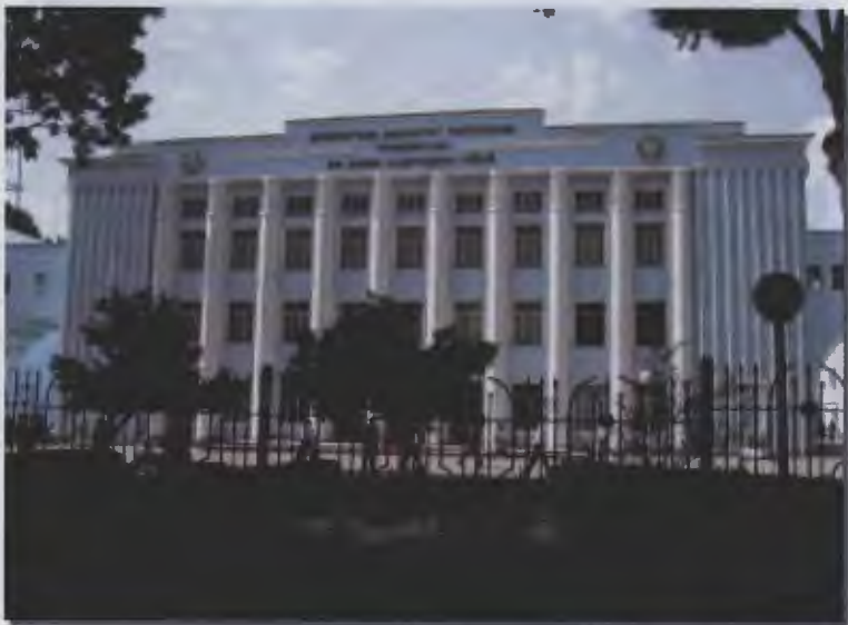
۲۵- دانشگاه ملی جمهوری تاجیکستان