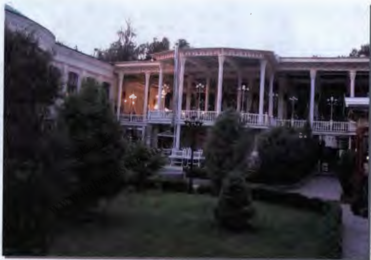
۴۰- چایخانه راحت شهر دوشنبه