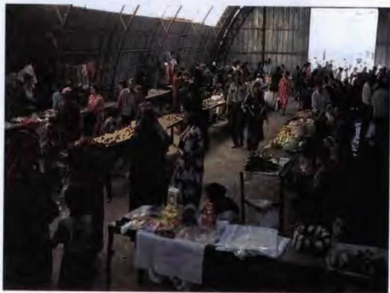
۴۱- بازار شاه منصور (زلونی) دوشنبه