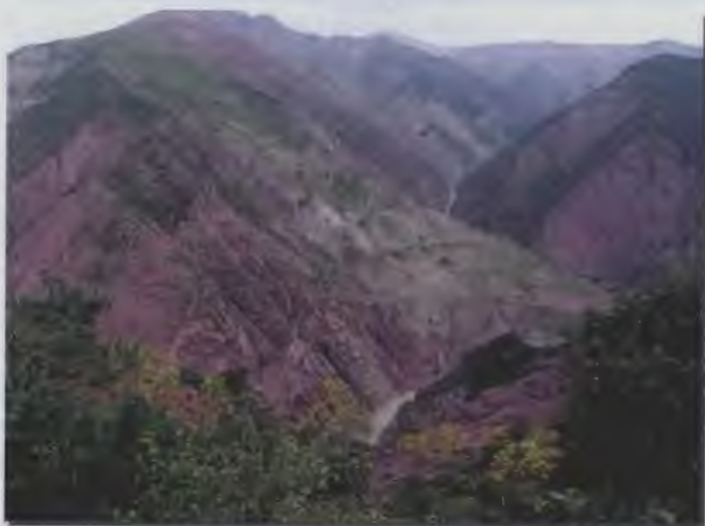
۲- آب و هوا