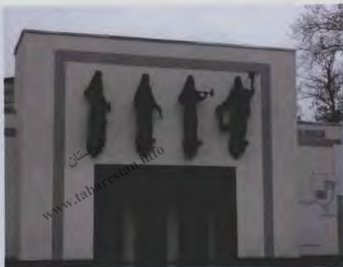
۲۸- نمایی از ساختمان تئاتر جوانان