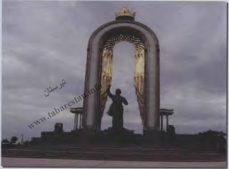
۹- تندیس امیر اسماعیل سامانی، میدان سامانی