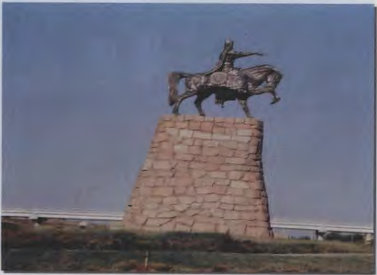
۱۰- میدانی در خجند، استان سغد