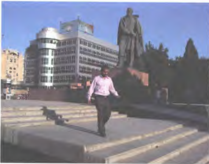
۳۹- میدان صدرالدین عینی، دوشنبه