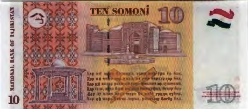
۴۳- تصویر پول ده سامانی (بوعلی سینا)