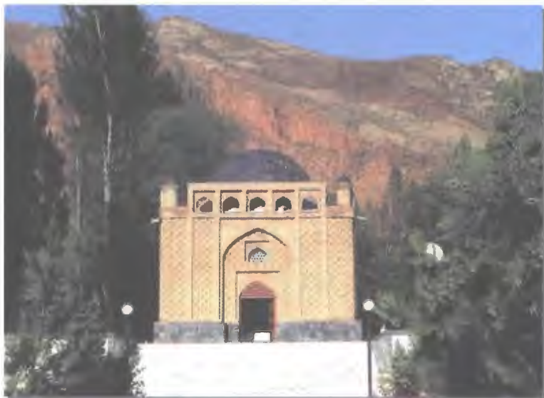
۳۷- آرامگاه رودکی، پنجکینت، استان سغد