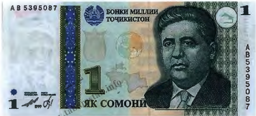
۴۲- تصویر پول یک سامانی (تورسون زاده)