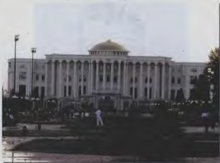
۱۴- کاخ ملت (کاخ ریاست جمهور)