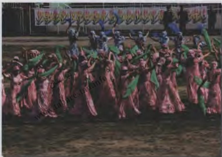
۱۹/۱ - مراسمی از یک جشن