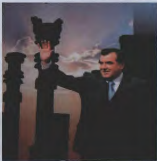
۱۸- امامعلی رحمان رئیس جمهور تاجیکستان