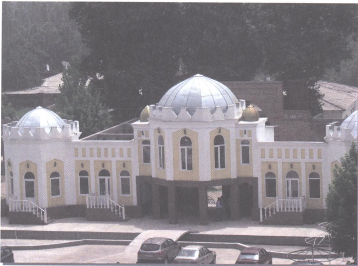
۳۵- مدرسه نو، حصار