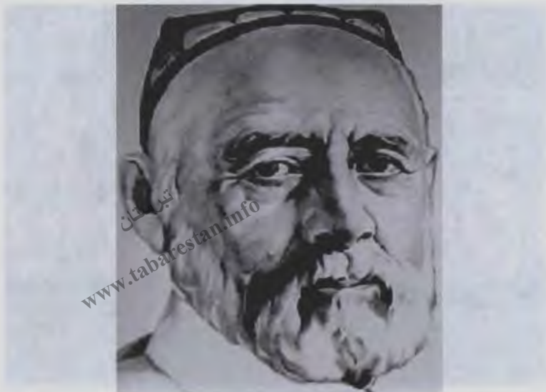
۱۷- صدرالدین عینی