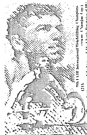
20th All International Writing Competition 1993-1994 University of the Islamic Republic of IR

«تی تی» یک نام زیبای گیلکی است که شکوفه معنی می‌دهد و در گذشته در دربار شاهان باستانی و فرمانروایان گیلان اغلب بر روی ملکه یا زن فرمانروا گذاشته می‌شود. این نام در فهرست «نامهای گیلانی برای دختران و پسران» در جلد اول «گیلان‌نامه» آمده است.